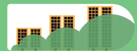
Bis 2050 könnten sich die CO 2 -Emissionen des Gebäudesektors verdoppeln oder verdreifachen.