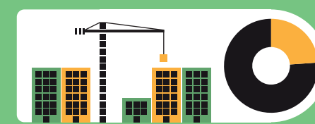
19 Prozent aller Treibhausgasemissionen waren auf Gebäude zurückzuführen.