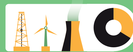
2010 verursachten Gebäude 32 Prozent des weltweiten Endenergieverbrauchs.

Weitere Informationen unter cisl.cam.ac.uk/ipcc und klimafakten.de